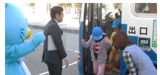
▲カンガルー保育園での出張教室