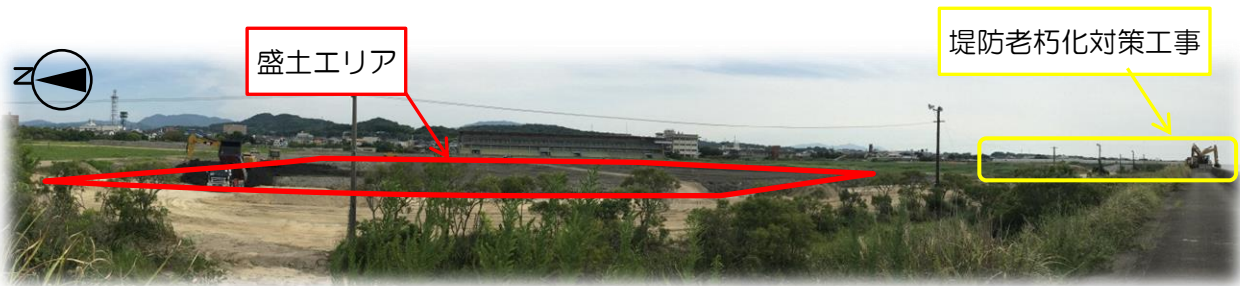
有明海側から競馬場スタンド方向を撮影（H29.9.13）

※工事にあたりましては、安全の確保および関係法令の遵守を最優先として、近隣の方々へのご迷惑を最小限にすべく、工事関係者一丸となって進めております。 ご理解とご協力のほど、よろしくお願いいたします。