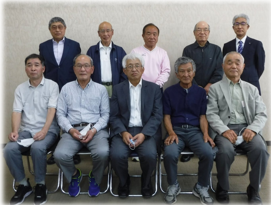
第 15 回審議会 (R4.4.28) 記念撮影