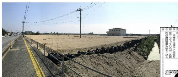
R2.8.27 現在（国道北側から）