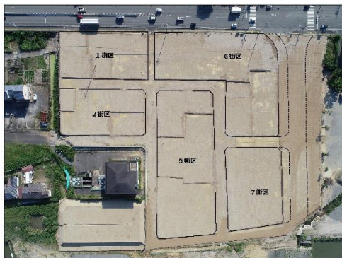
R2.8.27 現在（ドローン撮影）

ご協力により、R3年5月の使用収益開始に向けて道路及び水道及び下水道（雨水・汚水）の整備を進めております。